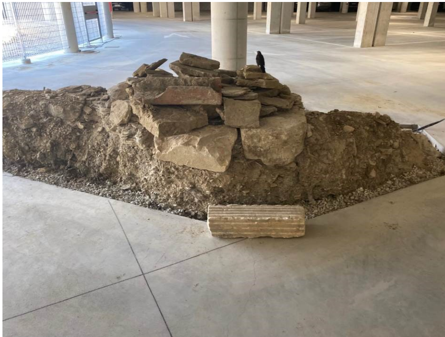
Foto Agosto 2020 con reperti a terra