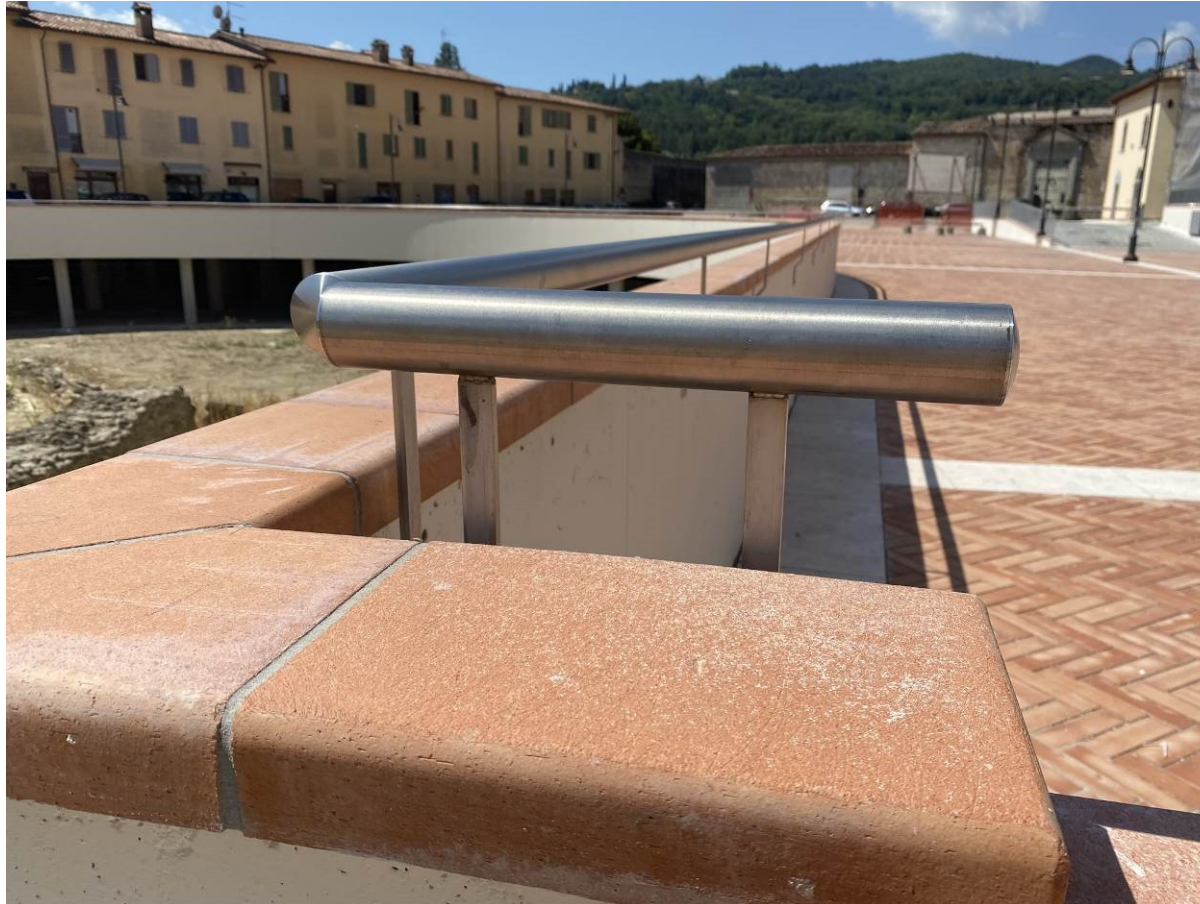
Parapetto in acciaio Inox Agosto 2020