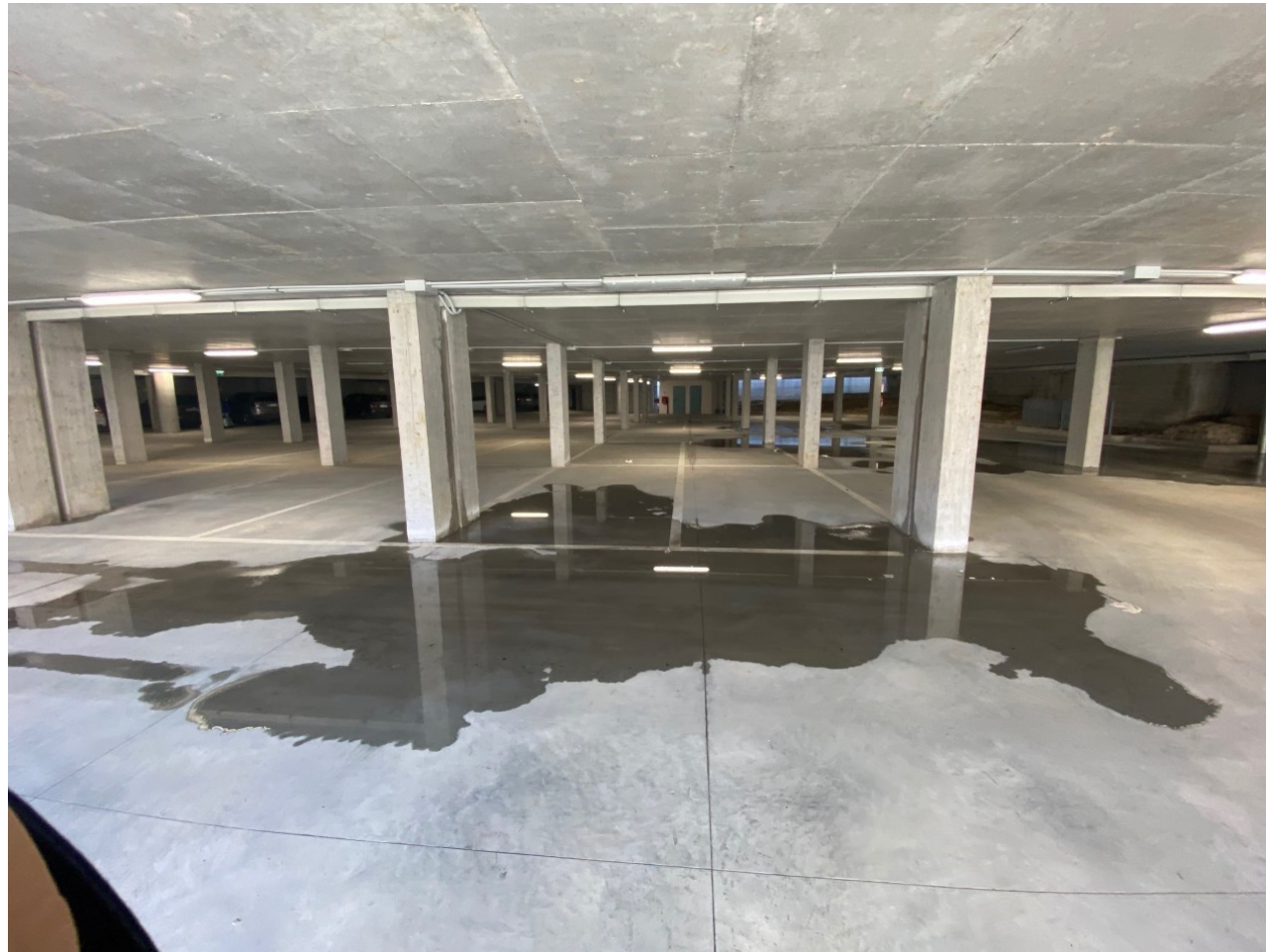
Area piano interrato con pozze per carenza di pendenze Febbraio 2020