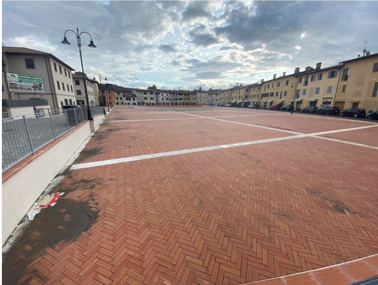
Aree di deposito sabbie dilavate dalla zona realizzata meno di un anno fa. Febbraio 2020