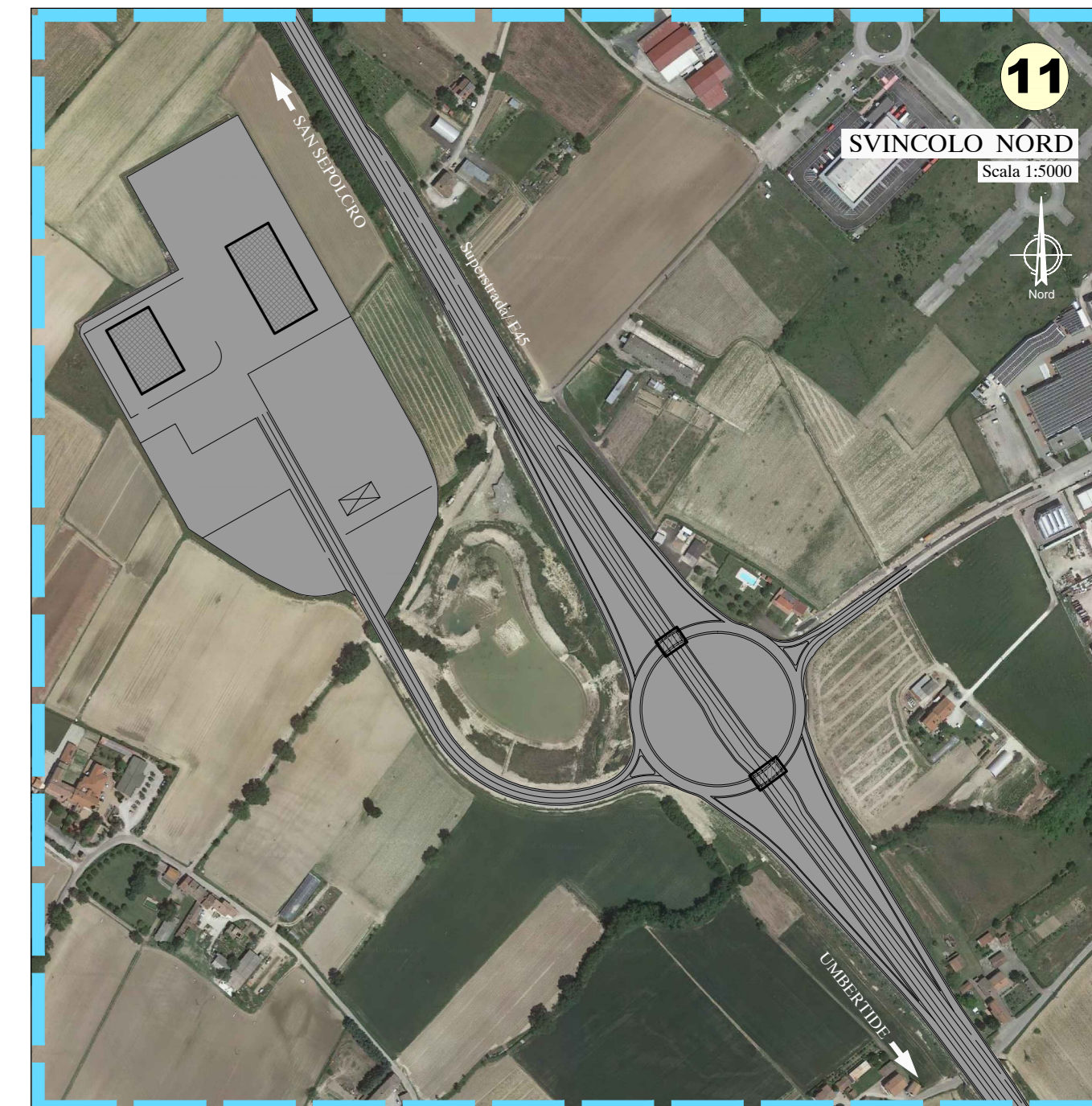
INTERVENTI FUORI INQUADRAMENTO